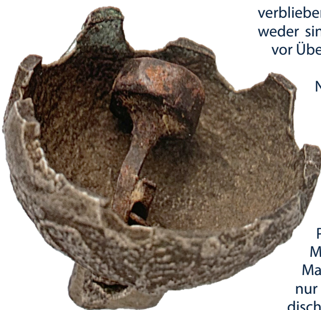
Glöckchen aus einer Altarzimbel (2. Hälfte 15. Jh.)