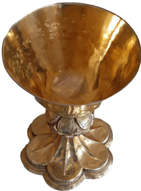
Abendmahlskelch (vor 1500)