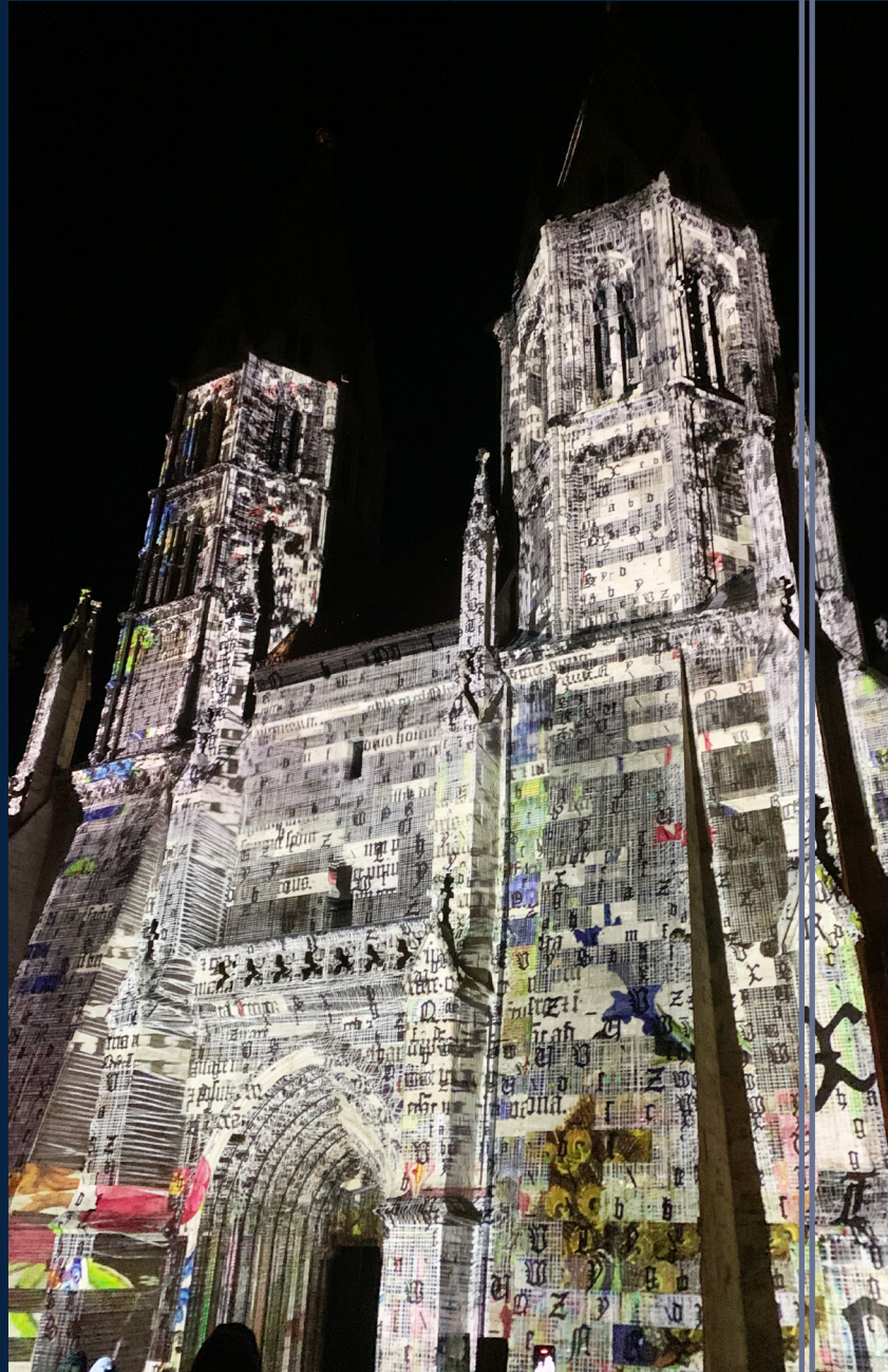
Divi-Blasii-Kirche mit Lichtinstallation zum Freiheitsleuchten am 18.10.2025

500 Jahre Bauernkrieg: Schauplatz Divi-Blasii-Kirche